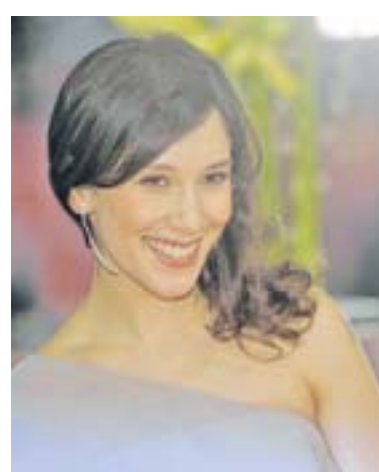
Sibel Kekilli wird zur Premiere von „What a man“ kommen.

Matthias Schweighöfer auch seine Kollegin Sibel Kekilli angekündigt. Die beiden spielen in der ersten Regiearbeit Schweighöfers gemeinsam und gehen von Düsseldorf aus auf große Kino-Tour. In „What a man“ ist die vielfach ausgezeichnete